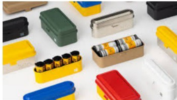
CUSTODIE PER PELLICOLE CUSTODIA PER 135/120 PAG. 4 CUSTODIA PER 135 PAG. 5