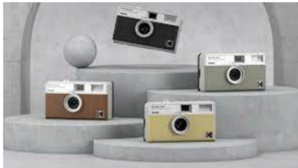
EKTAR H35 HALF FRAME FOTOCAMERA A PELLICOLA, MEZZO FORMATO PAG 2,3