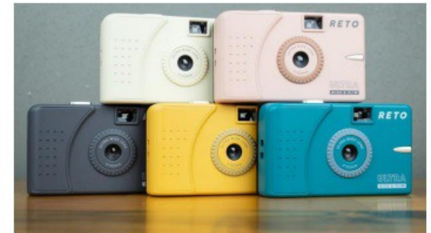
RETO ULTRA WIDE&SLIM FOTOCAMERA A PELLICOLA, GRANDANGOLARE PAG. 6,7